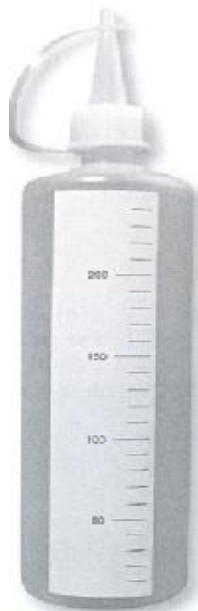
5364100 Blandeflaske med målinndeling 250 ml.