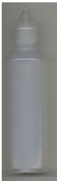
3873100: Blød plastflaske med skrivespids 80 ml.