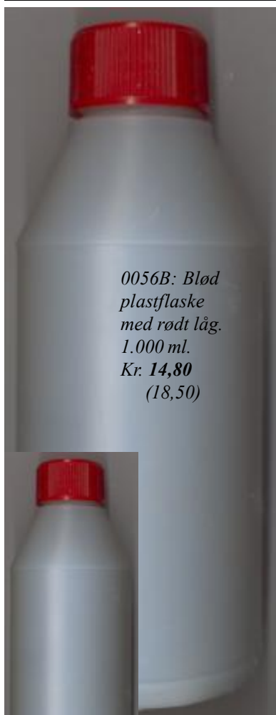
0056B: Blød plastflaske med rødt låg. 1.000 ml. Kr. 14,80 (18,50)