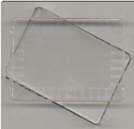
0056: Klar plastæske med låg ca. 57x32x12 mm.